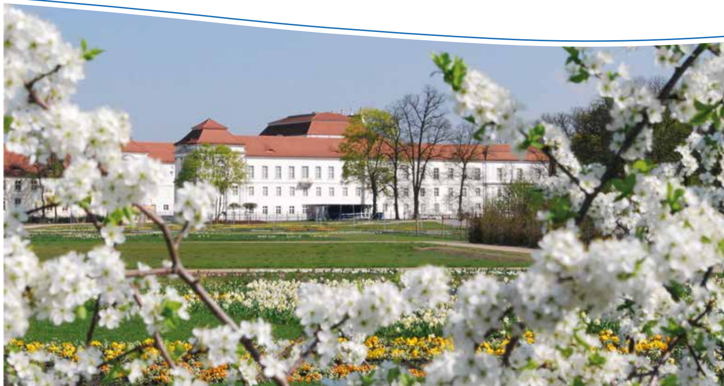
Schlosspark mit Schloss Oranienburg

Um längere Wartezeiten zu vermeiden, wird empfohlen, möglichst vorab individuelle Termine abzusprechen – direkt bei der jeweiligen Ansprechperson oder unter info@oberhavel.de. Abweichende und erweiterte Sprechzeiten unter: www.oberhavel.de/Sprechzeiten